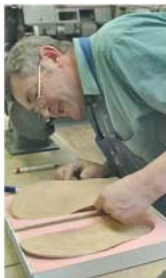
Die Seidl-Maßeinlagen werden mit viel Aufwand hergestellt.

Einlagen von der Firma Seidl sind trotzdem echte Präzisionsarbeit. Die Maßeinlagen werden zum Beispiel aus solidem Mikro-Qualitätskork nach einem individuellen Fußabdruck angefertigt. Noch im Rohzustand werden sie am Kundenfuß auf ihre Passform kontrolliert. Zu diesem Zeitpunkt kann noch ohne Probleme nachgearbeitet werden. Sowohl die Komfort-Polstersohle als auch die Decksohle kann sich der Kunde für sein optimales Ergebnis selbst auswählen. Und